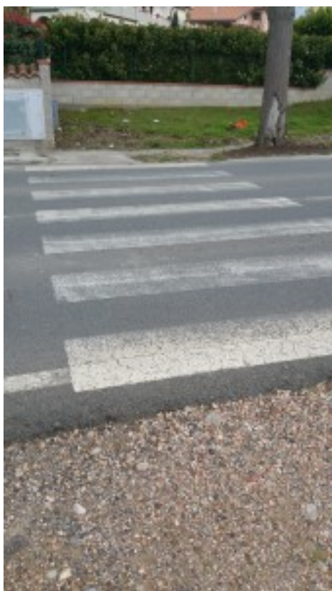
Attraversamento via Massetana

Il M5S di Follonica ha protocollato in questi giorni una mozione riguardante un tema molto sentito dai cittadini